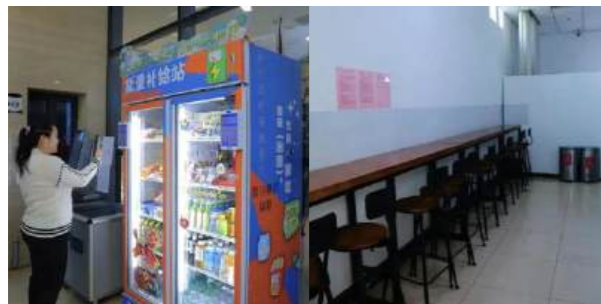
通州区图书馆设置食品自动售货机和读者用餐区

学习干饭两不误，图书馆也有烟火气。为满足读者在阅读学习间隙的用餐需求，多地图书馆纷纷开辟读者用餐区或读者餐厅，解锁“学习+美食”新姿势。