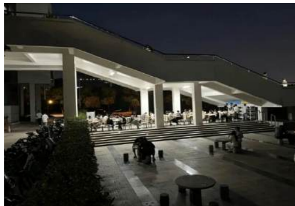
改造后的南昌大学图书馆用餐区

间闲置……如今，改造后的这一区域变身暖光环绕的“干饭角”。有同学表示，“以前外卖都是放地上，也没有专门座位，现在我们可以在这里及时用餐，晚上还有灯光照着吃饭，相比从前更方便更安全了！”