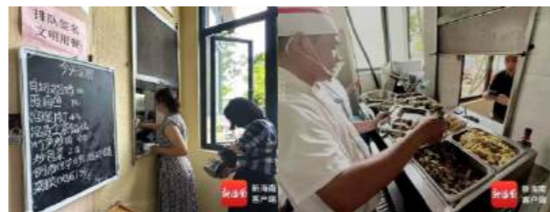
读者在海南省图书馆读者共享用餐区打菜

海南省图书馆则通过资源优化配置，将原员工餐厅升级为读者共享用餐区，白切文昌鸡、煎海鱼、宫爆肉丁等家常菜价格亲民，12元即可吃饱，米饭例汤还免费供应。上海青浦区图书馆读者餐厅也焕新归来，每日菜单根据时令食材灵活调整，满15元赠送水果或酸奶，轻松实现“荤素搭配+主食+汤”的完美组合，获得读者广泛好评。