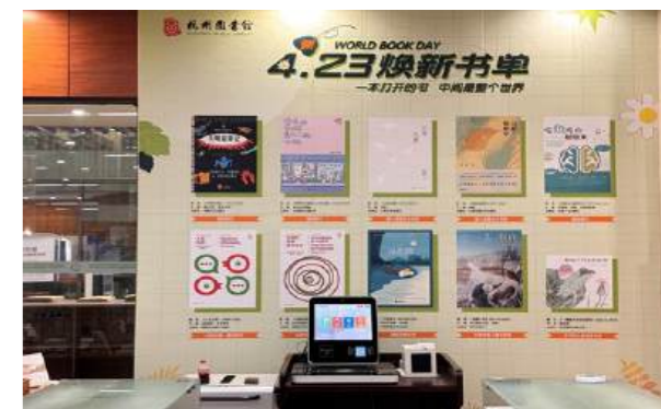
(图片:杭州图书馆“乐享一小时”沉浸式读书会配套书展)

为此,公共图书馆需基于读者实际需求,对阅读疗愈服务进行系统规划与内容设计,构建完整、清晰的服务框架,以保障其有序、连贯地推进。以杭州图书馆“乐享一小时”读书会为例,该活动以“精读好书,探寻幸福”为主线,划分为Yue己和Yue他两个维度,并配有专题读书工具包。活动按主题分周次展开,每期持续4至8周,并通过整体预告使读者清晰了解全程安排。