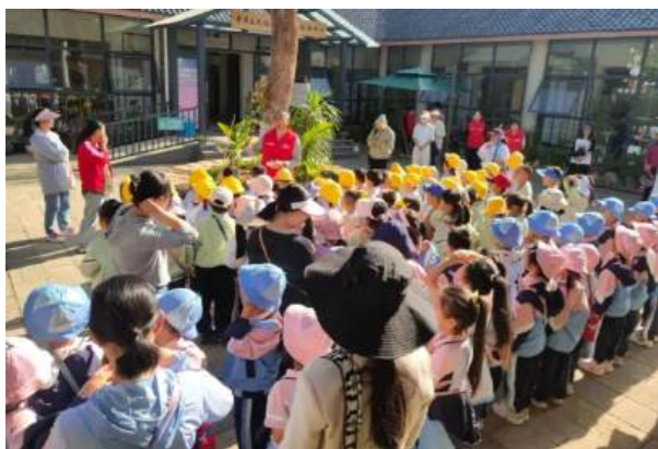
幼儿园师生到晋宁区图书馆开展游学活动

在云南昆明，白墙黛瓦的晋宁区图书馆坐落于绿植繁茂、景观雅致的和璟苑公园内，利用公园得天独厚的生态环境，改造提升后的图书馆实现了“游公园”与“品文化”的无缝衔接。馆方还面向团体游客推出“定制化文旅服务”，针对家庭游客推出“亲子阅读+寒暑假套餐”，结合晋宁历史文化推出“书的历史”系列、“典耀中华”系列文旅活动，解锁“阅读+旅游+党建”的创新服务模式。