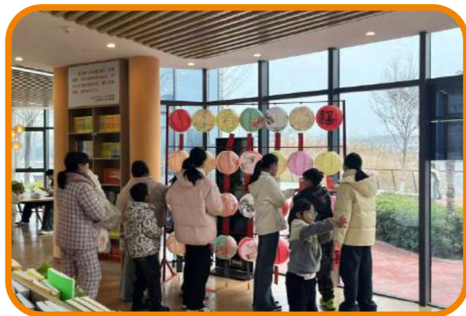
3月3日，温县图书馆在慈胜书屋举办元宵节猜灯谜活动。