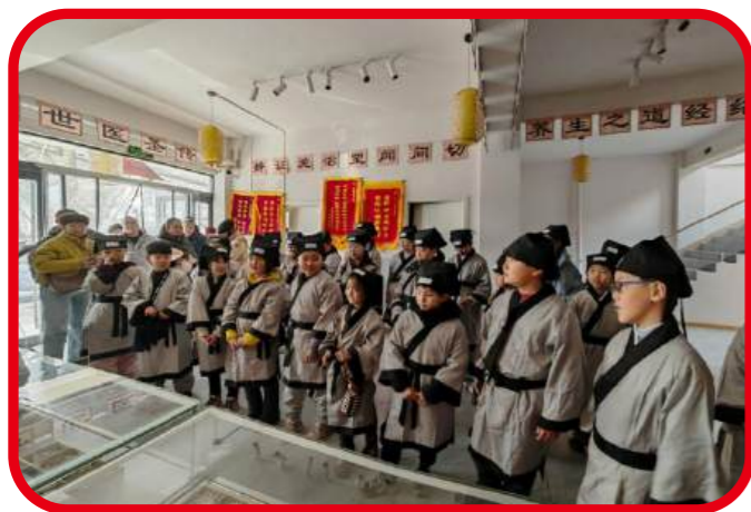
1月3日，焦作市图书馆组织开展“书香带你去旅行”之“我是小中医”研学活动。