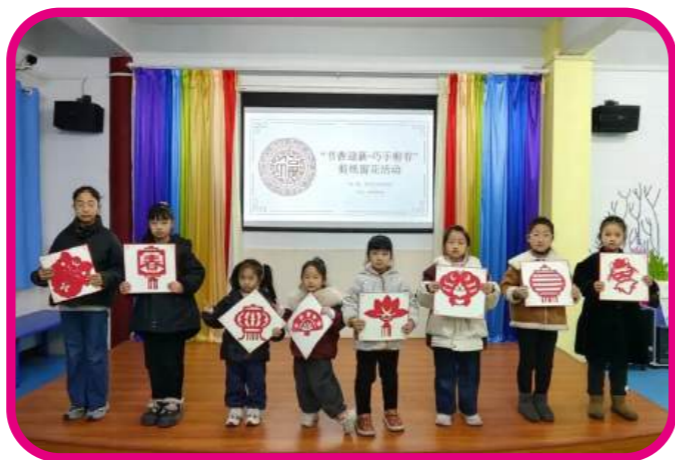
1月18日，博爱县图书馆组织“书香迎新·巧手剪春”活动，开启创意剪纸之旅。