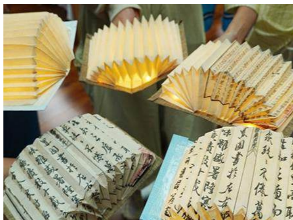
(图片:湘潭大学“心灵疗愈·创意书灯”DIY活动)

在组织疗愈服务时,公共图书馆应有意识地将文本内容转化为可感知、可动手的趣味体验,使文字与活动自然结合,通过低门槛、受欢迎的形式,吸引更多广泛的参与者,延伸活动影响力。例如,在以疗愈绘本为主题的读书会中,可以加入“一纸成书”的手作环节,引导读者通过折、剪、画等方式,将平面纸张转化为立体故事书,并在创作中融入自身的情感经历。