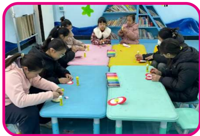
3月8日，孟州市图书馆开展文润孟州·巧手工坊——“指尖传情 致敬女神”创意贺卡活动。