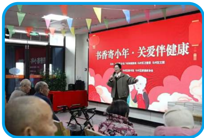
2月10日，马村区图书馆走进综合养老服务中心，为老人送去图书和精彩的表演。