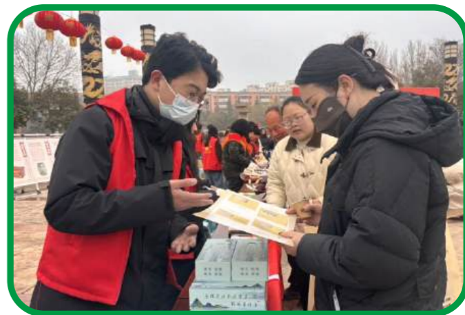
3月5日，武陟县图书馆走进人民广场，开展“学雷锋 我行动”志愿服务活动。