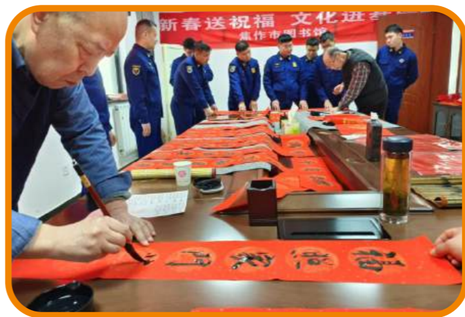
2月12日，焦作市图书馆开展“新春送祝福 文化进基层”送春联活动。