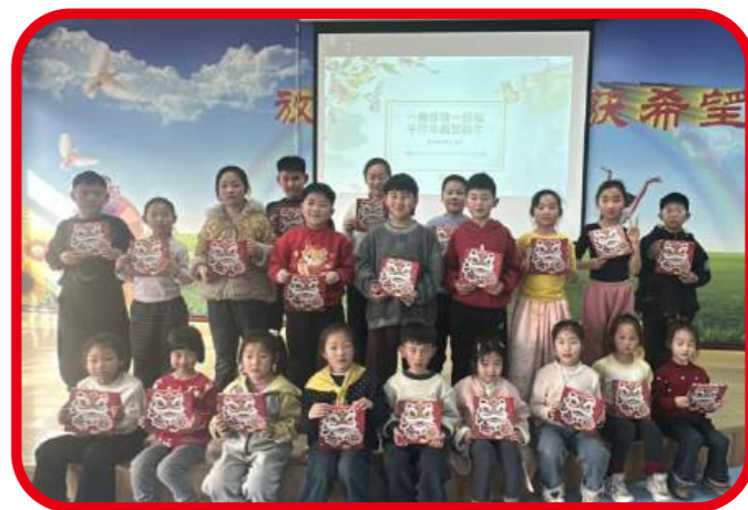
2月21日，沁阳市图书馆开展“一颗珍珠一份福·手作年画贺新年”珍珠画手工活动。