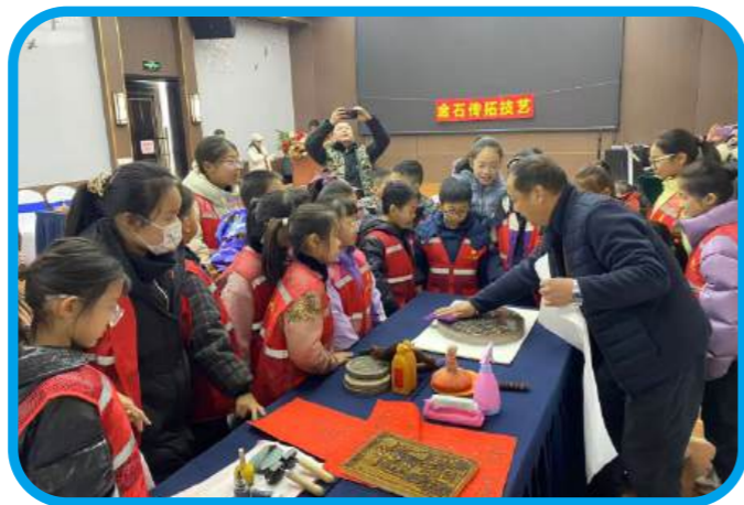
2月7日，焦作市图书馆组织开展“书香带你去旅行”之“非遗金石传拓”研学活动。