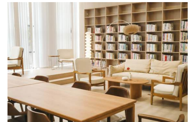
（图片：浙江传媒学院图书馆“疗愈书房”）

情绪，而天竺兰、梅花与橙子的香气则能安抚心神、减轻焦虑。触觉体验同样深刻作用于用户心理，物体的重量、质感与硬度会在无形中影响人们对他人及情境的判断与反应，在疗愈空间中，通过安排适宜材质、软硬及温度的物品，使人在交互中获得持续的感觉反馈，可逐步调节心理状态、重建认知模式，例如，柔软的物品常能缓解不确定感，增强信任；温暖触感往往带来放松，清凉触感则有助于清醒思考。视觉环境对心理的作用亦不容忽视，疗愈空间光照的强度、色温与持续时间均直接或间接地影响情绪，研究显示，300lx、3000K的暖白光或1500lx、4000K的冷白光容易引发积极情绪反应，此外，不同色彩也会通过视觉传递不同情绪感受，进而影响整体心理状态。