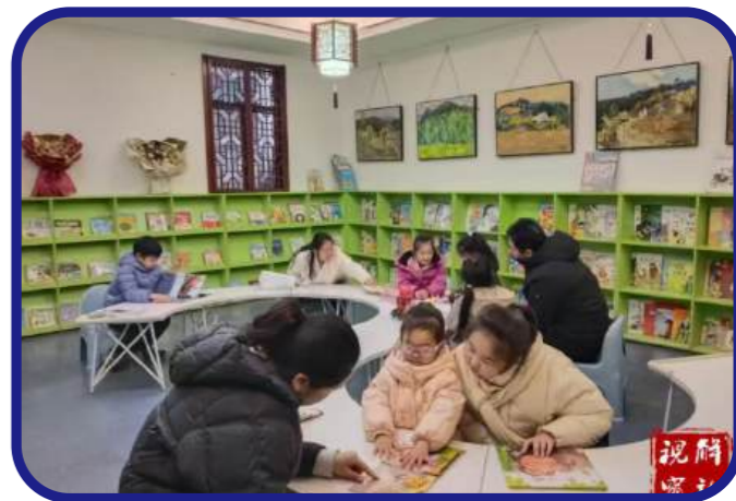
3月11日，解放区图书馆在百年焦作城市书屋举办“绘声绘色”亲子故事会活动。