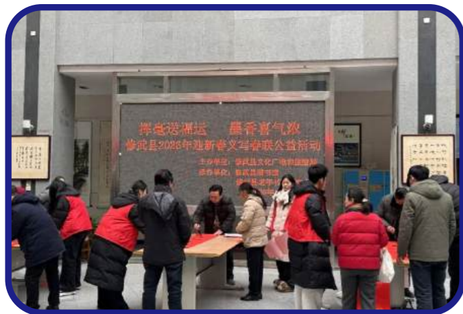
1月31日，修武县图书馆举办“挥毫送福运·墨香喜气浓”义写春联公益活动。