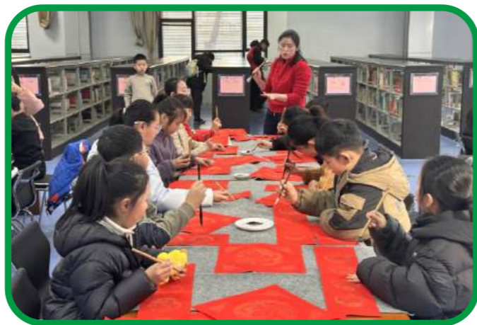
2月11日，焦作市图书馆开展“小手写福纳祥”写春联活动。