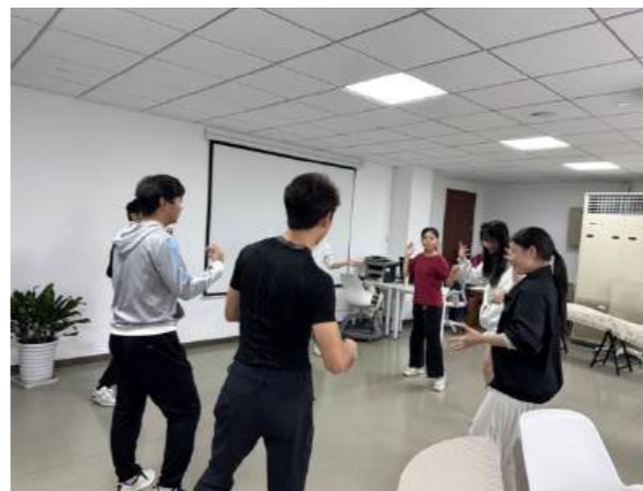
(图片:整合多种心理辅导技术进行阅读疗愈|来源:网络公开)

感。这一系列过程,实质上是在审美体验中完成的情感学习与情绪管理练习。当疗愈对象逐渐感受到自己能够在这个过程中理解情绪、释放压力并获得共鸣与启发时,便会积累积极的心理体验,从而使其相信自己未来在更广阔的生活场景中,也能更好地识别、调节与表达情绪。